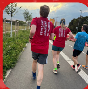
Community Runs Monatliche Events für Jedermann