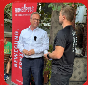
Networking Vernetzung und Business