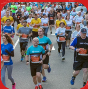
Firmenlauf Emotionaler Höhepunkt

Unternehmen brauchen mehr als Prozesse: Menschen, die verbunden sind und gemeinsam wachsen.