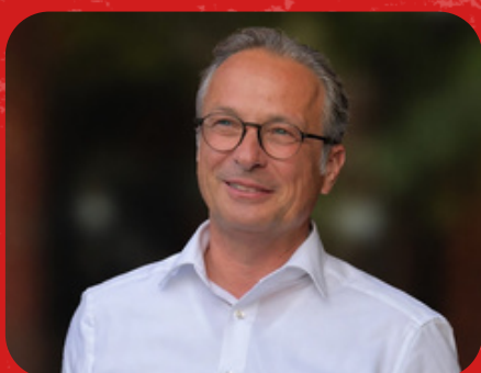
Rainer Breuer Bürgermeister der Stadt Neuss

Der FIRMENPULS bringt Menschen in Bewegung und unsere Stadt zusammen. Er macht Neuss sichtbar als aktiven und lebendigen Standort.